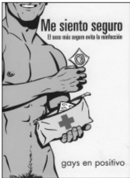
Campanya de Gais Positius a favor del sexe + segur

Com es transmet la SIDA? Creus que es pot parlar de «grups de risc», com s'ha fet fins no fa gaire, o s'ha de parlar de «pràctiques de risc»?