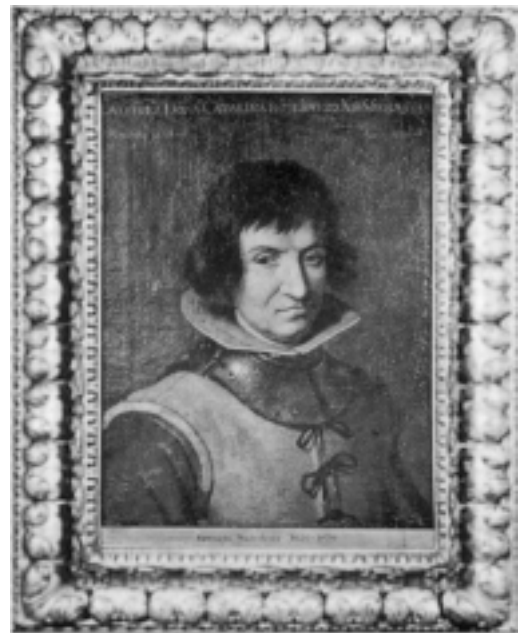
El alférez doña Catalina de Erauso, obra de Francisco Pacheco (1564-1644)

Quin paper juga en aquest esquema l'orientació del desig, l'orientació sexual?